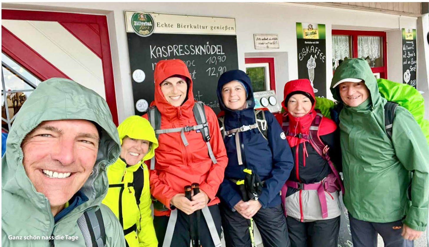
Ganz schön nass die Tage