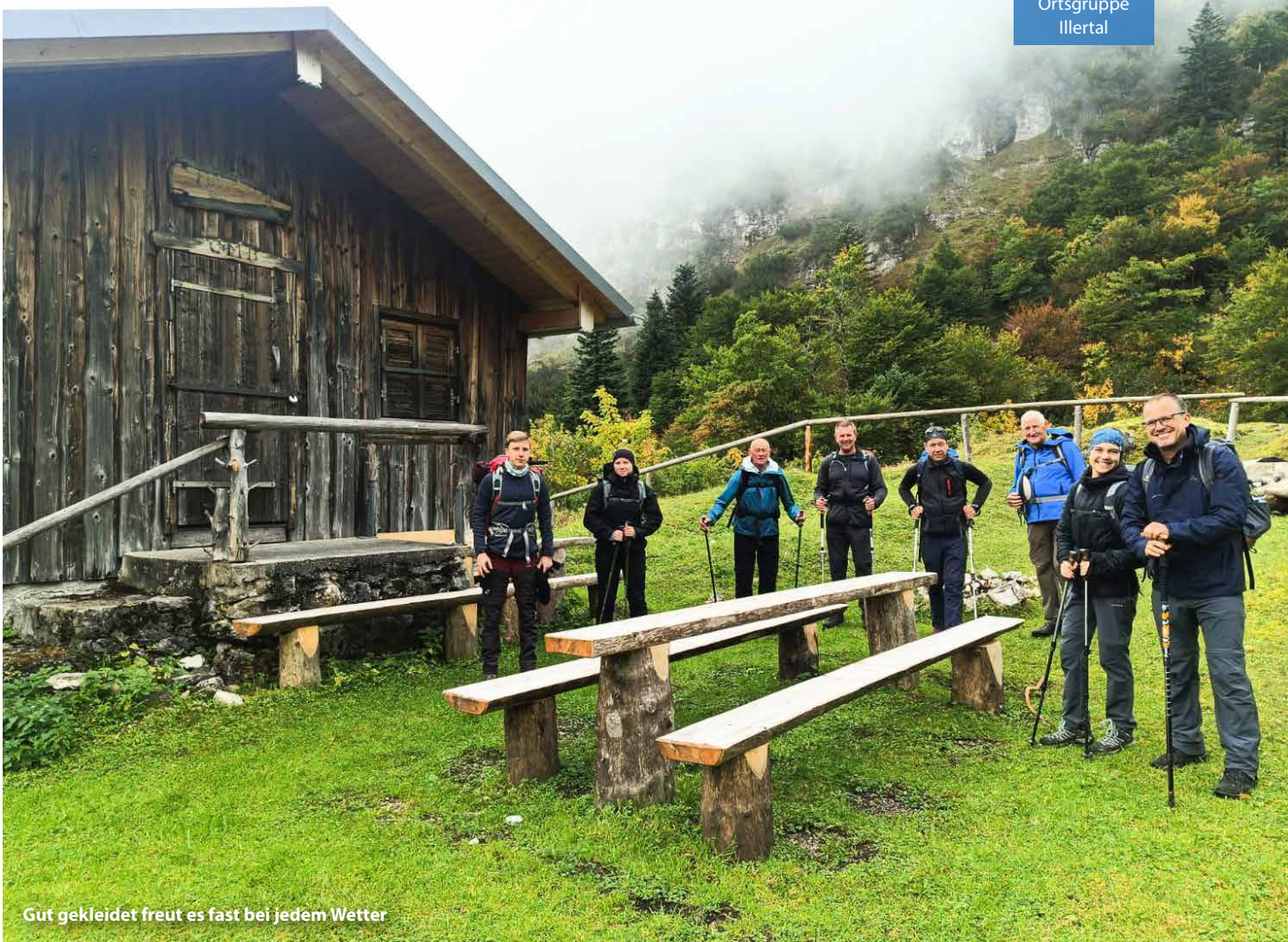
Gut gekleidet freut es fast bei jedem Wetter

den Henneck und weiter zum Hohen Fricken, 1.940m, bot atemberaubende Ausblicke auf das Wettersteinmassiv, die Zugspitze und tief unter uns das Loisachtal. Beim Abstieg kehrten wir noch auf der Esterbergalm, 1.264m, ein, wo wir in der Sonne unser wohlverdientes Mittagessen genossen. Danach ging es hinunter nach Garmisch, wo wir erschöpft, aber glücklich ankamen.