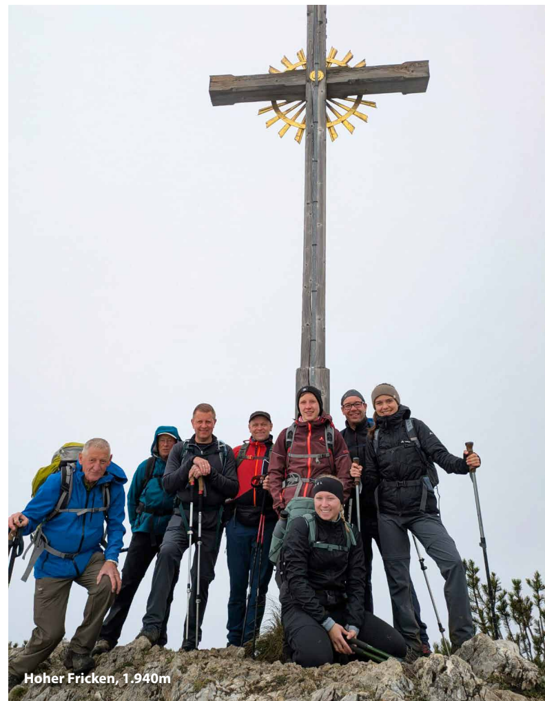
Hoher Fricken, 1.940m